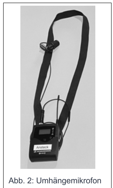
Abb. 2: Umhängemikrofon

Das Umhängemikrofon (-> Abb. 2) besteht aus einem Taschensender mit Tragegurt und einem Ansteckmikrofon am Gurt. Schalten Sie das Mikrofon ein (-> Abb. 4) und hängen Sie sich den Gurt um den Hals. Beachten Sie dabei, dass das Mikrofon nach oben in Richtung Mund zeigt. Das Umhängemikrofon liegt am Mischpult auf Kanal 2 an und ist standardmäßig am Mischpult stumm geschaltet, d.h. der MUTE-Button leuchtet rot (-> Abb. 7).