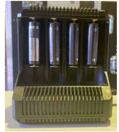
Abb. 9: Ladegerät zum Aufladen der Akkus