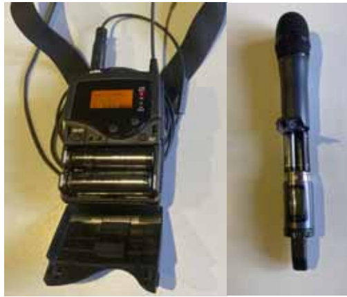
Abb. 8: Zum Wechseln der Akkus: Umhängemikrofon aufklappen, Handmikrofon unten aufschrauben

Das Handmikrofon und das Umhängemikrofon werden von jeweils zwei Akkus mit Strom versorgt. Eine Anzeige für den Akkustand befindet sich im Display des jeweiligen Geräts. Am Ende ihrer Vorlesung, oder wenn das Batteriesymbol während der Vorlesung zu blinken beginnt, sollten Sie die Akkus austauschen (-> Abb. 8). Das Ladegerät (-> Abb. 9) zum Aufladen der Akkus befindet sich an der Regie. Hier sollten Sie auch immer vier geladene Akkus vorfinden. Eine grüne bzw. rote LED auf der Oberseite des Ladegeräts gibt an welche Akkus gerade laden -> ROT, oder geladen sind -> GRÜN.