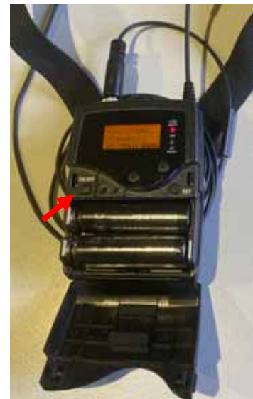
Abb. 4: Zum Einschalten ON/OFF-Taste lange drücken