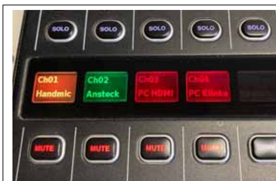
Abb. 7: Übersicht der Kanäle und MUTE-Buttons