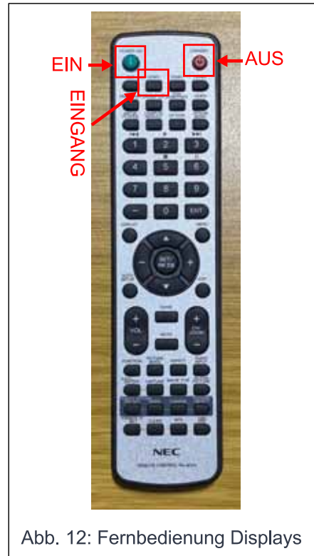
Abb. 12: Fernbedienung Displays