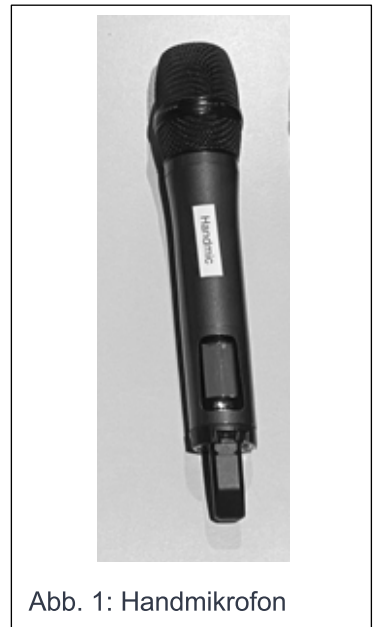
Abb. 1: Handmikrofon

Das Rednerpult ist mit einem kabellosen Handmikrofon (Abb. 1) ausgestattet, welches zunächst eingeschaltet werden muss (Abb. 3). Das Mikrofon ist auf ein flexibel positionierbares Mikrofonstativ aufgesteckt und kann bei Bedarf auch entnommen werden. Halten Sie das Handmikrofon dann am Griff. Decken Sie beim Halten des Mikrofons nicht die Antenne am unteren Ende des Mikrofons ab, um die Funkverbindung zur Regie nicht zu beeinträchtigen. Das Handmikrofon liegt am Mischpult auf Kanal 1 an und ist standardmäßig am Mischpult stumm geschaltet, d.h. der MUTE-Button leuchtet rot (-> Abb. 7).