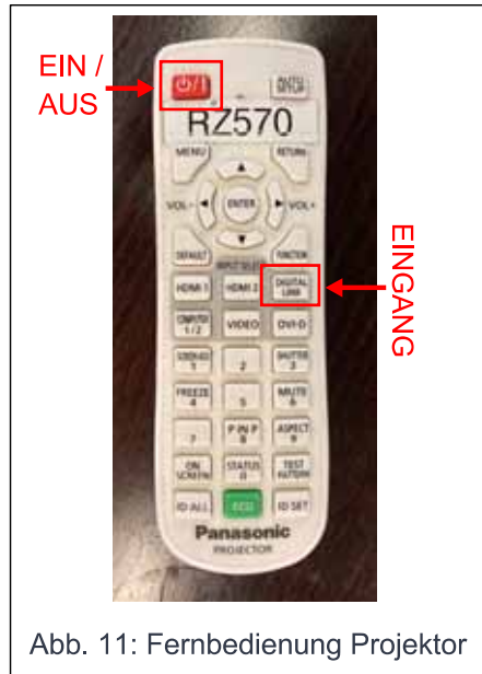
Abb. 11: Fernbedienung Projektor

An der Regie finden Sie zwei Fernbedienungen, eine für den Projektor (-> Abb. 11) und eine für die beiden Displays (-> Abb. 12), welche in den Seitenschiffen hängen. Schalten Sie die Geräte an und stellen Sie sicher, dass die korrekten Eingänge ausgewählt sind: Projektor -> DIGITAL LINK, Displays -> HDMI1.