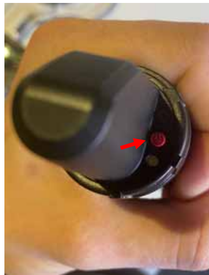
Abb. 3: Zum Einschalten ON/OFF-Taste lange drücken